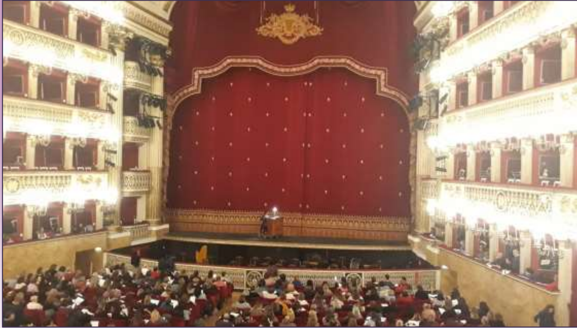
TEATRO SAN CARLO